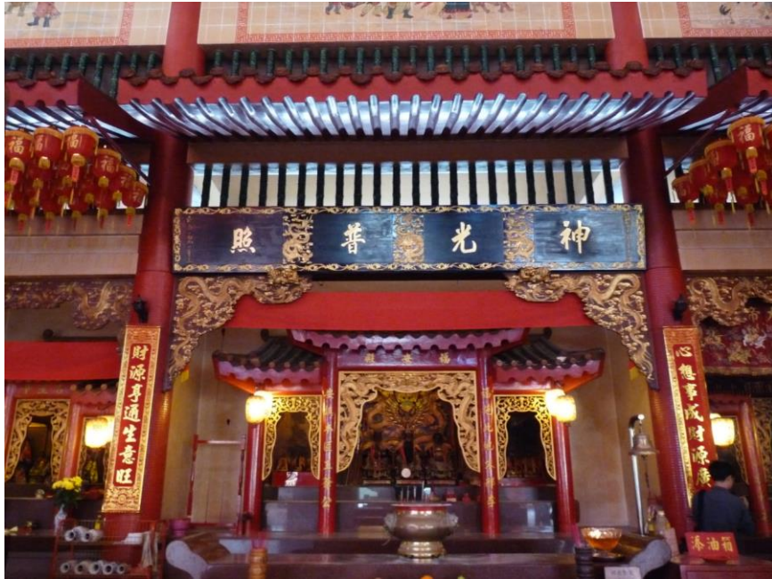
圖3：淡濱尼聯合宮的福安殿。案上僅置天公爐而無天公神像或神牌。