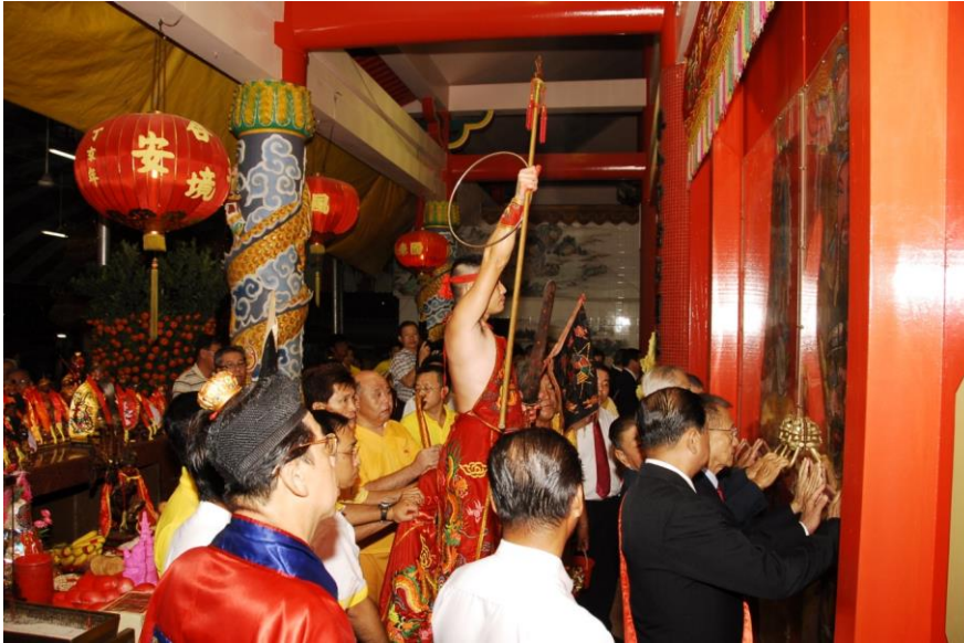
圖5：淡濱尼聯合宮擴建慶成典禮的開宮門儀式。

次日，請水淨壇的儀式開始，乩童帶領十位燈主在天公爐前參拜，道士隨即誦經請天公出巡。信徒備好供桌、金器、供飯、供果等，待一切準備就緒後，燈主一行人便前往附近的斗母宮請水，據悉是因為斗母宮仍保留一口井，井水是燈主公認的聖水。 88 在取水的過程中，道士負責念誦經文，乩童試嘗井水。待儀式結束後，隊伍返回廟裡，乩童(天公)以米、油、鹽、糖、罐頭、米粉、汽水和酒等「犒軍」，並進行「普施」，將供品分發給信徒。這時也舉行屠宰豬、羊的「獻熟」儀式，井水則用於泡茶以敬天公。燈主各捧著一盤鵝腳，鵝腳上戴有兩枚戒指，作為「獻熟」的祭品之一。燈主手提燈籠入殿，道士誦經請天公回天宮，率眾到正門處向象徵天宮的三層紙宮進香行禮。道教最通行的三層壇的空間解構，具有特殊的宗教象徵意義：上層法天，中層象人，下層體地。 89 燈可照徹天界地府，供道場之用的「淨水」，則有壇淨神安的作用。道士帶信徒到空地焚燒祭品，祭品包括紙宮、服飾、一堵由紙錢砌成的「圍牆」及象徵五方神靈的五色(紅、綠、