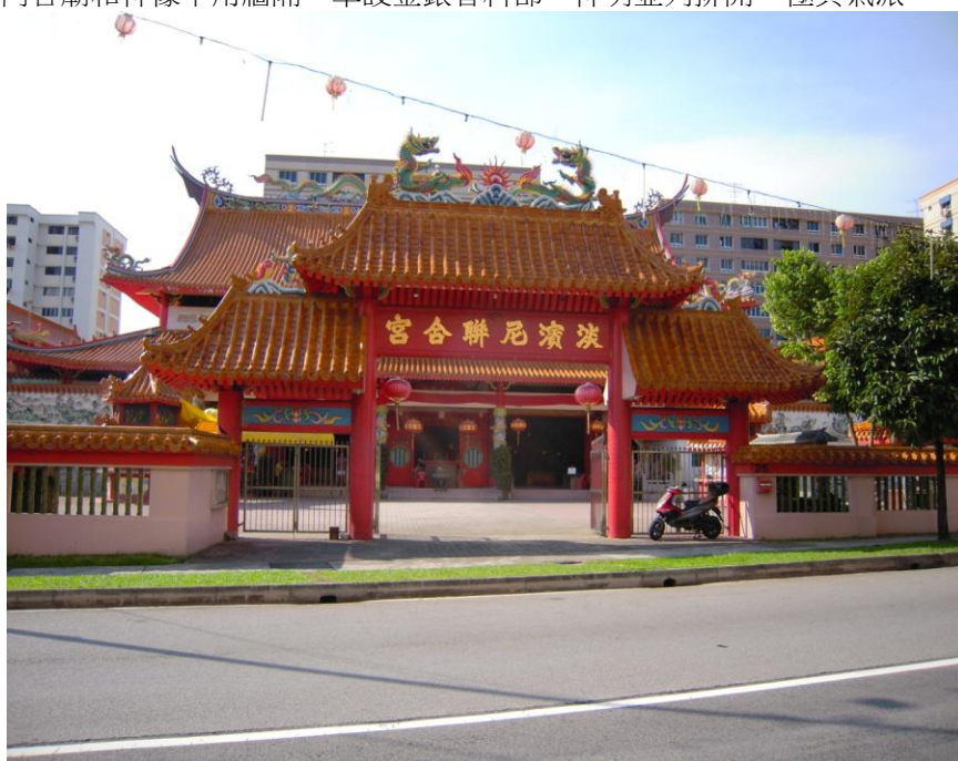
圖4：今天的淡濱尼聯合宮。

條龍和四隻鳳點綴。宮前兩旁繪八仙過海圖和九龍戲珠圖，皆以道教文化的符號為主。淡濱尼聯合宮的一大特色就是實行通殿式格局，在一個大殿內各廟和神像不用牆隔，單設金銀香料部，神明並列排開，極其氣派。